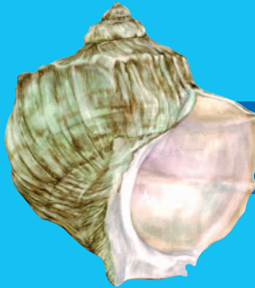
Lasawa ( Turbo marmoratus )