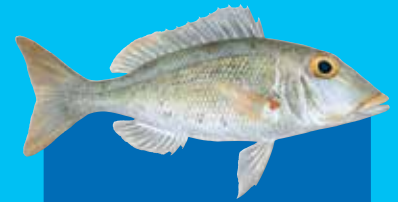
Yelolip redmaot Yellowlip emperor ( Lethrinus xanthochilus )