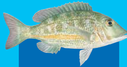
Yelostraep redmaot Orange-striped emperor ( Lethrinus obsoletus )