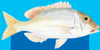
Yelo-tel redmaot Pacific yellowtail emperor ( Lethrinus atkinsoni )