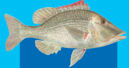
Rednek redmaot Trumpet emperor ( Lethrinus miniatus )