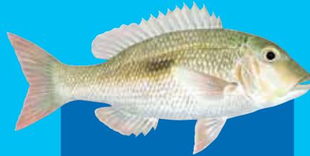
Blakspot redmaot Thumbprint emperor ( Lethrinus harak )