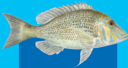
Spankled redmaot Spangled emperor ( Lethrinus nebulosus )