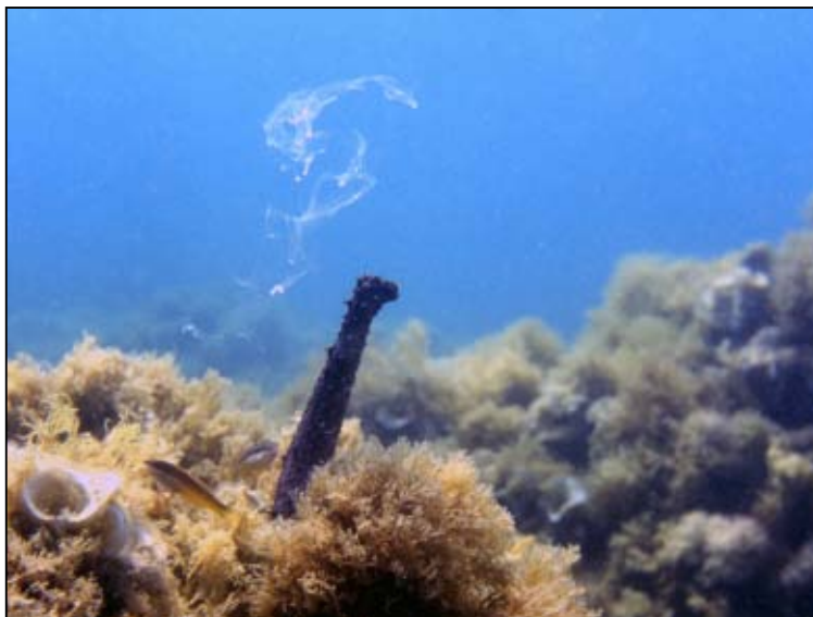
Holothuria tubulosa

Remarque : Plusieurs autres concombres de mer poussaient au même moment dans la zone alentour.