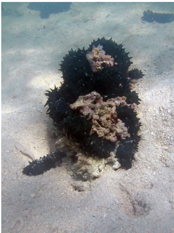
Figure 3. Concentration de juvéniles de Stichopus chloronotus.

caractéristiques que celles observées chez S. chloronotus . Après des observations identiques, Reichenbach (1999) conclut que le recrutement de H. fuscogilva a lieu dans des herbiers peu profonds. En outre, l'holothurie noire à mamelles H. nobilis a été observée au stade subadulte (10–15 cm) dans des herbiers intertidaux à Zanzibar (observations personnelles de l'un des auteurs du présent article, H. Eriksson), situés au sein de l'habitat de prédilection de l'adulte sur le platier récifal. Le même type d'observations a été signalé pour l'espèce H. whitmaei dans le Pacifique (Byrne et al. 2004). Conand (1993) a également constaté des tendances semblables pour le recrutement de S. hermanni dans des eaux peu profondes (platiers récifaux de faible profondeur ou herbiers). Ces observations démontrent qu'un grand nombre d'espèces d'holothuries exploitées par la filière bêche-de-mer sont tributaires de plusieurs habitats marins côtiers et mettent en avant la nécessité de tenir compte des considérations écosystémiques dans la gestion des stocks d'holothuries. S. chloronotus est capable de se reproduire par reproduction sexuée et asexuée (Franklin 1980 ; Conand et al. 2002). L'espèce semble se reproduire par scission pendant la saison hivernale plus fraîche lorsque la reproduction sexuée est en sommeil (Uthicke 1994 ; Conand et al. 1998). Les spécimens observés au cours de l'étude, pourtant réalisée en hiver, ne présentent toutefois aucun signe de reproduction scissipare.