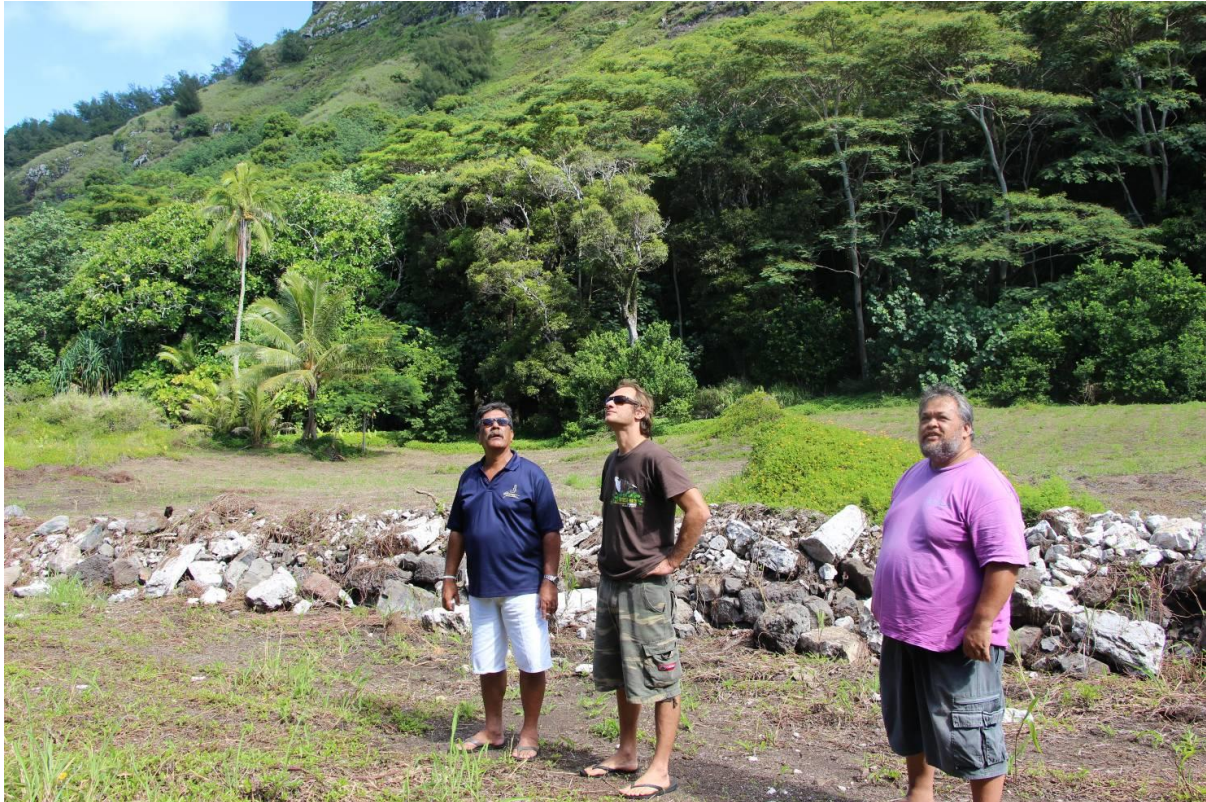
Figure 4 : Visite du futur site de la pépinière communale en janvier 2016 (maire, SOP Manu, SDR)

Par ailleurs, il est également prévu de remettre en état la pépinière du Centre d'Education au Développement (CED) de Rikitea afin de disposer d'un site de sensibilisation à la flore plus proche d'un centre d'enseignement mais également plus rapidement en production, la pépinière de la commune étant encore au stade de conception. Pour ce faire, il conviendra uniquement de financer du matériel de pépinière basique (ombrières, système d'arrosage, bacs de germination, pochons...) selon les besoins identifiés en relation avec l'enseignant chargé de l'agriculture.