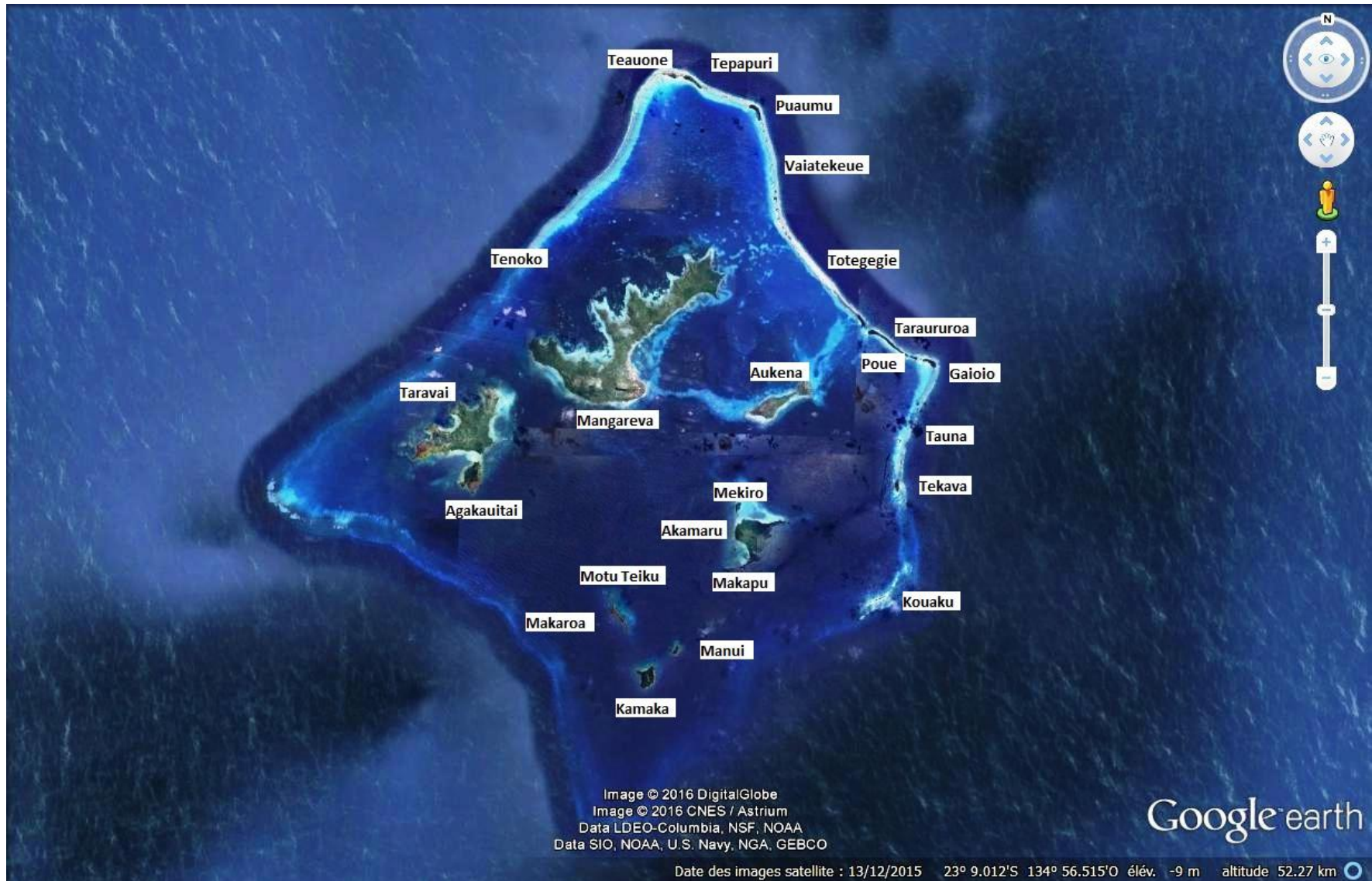
Figure 1 : Carte de l'archipel des Gambier