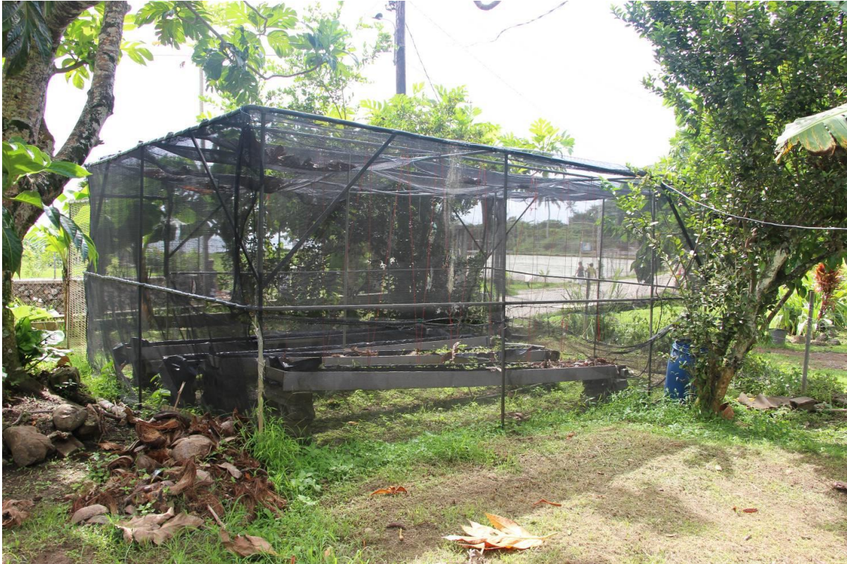
Figure 5 : Pépinière du CED à remettre en état