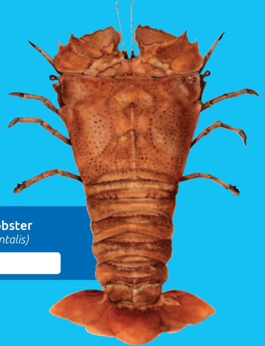
Flathead lobster ( Thenus orientalis )