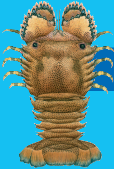
Caledonian slipper lobster ( Parribacus caledonicus )