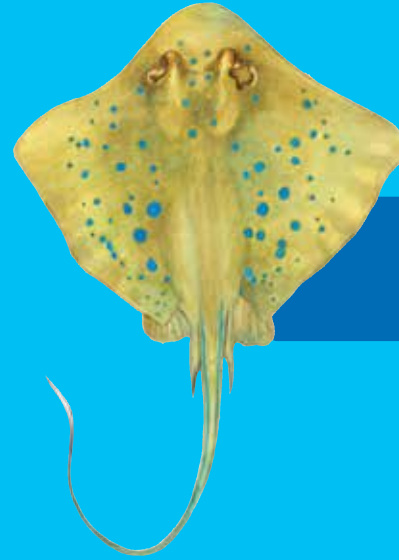
Blu spotted stingrei Blue-spotted stingray ( Dasyatis kuhlii )