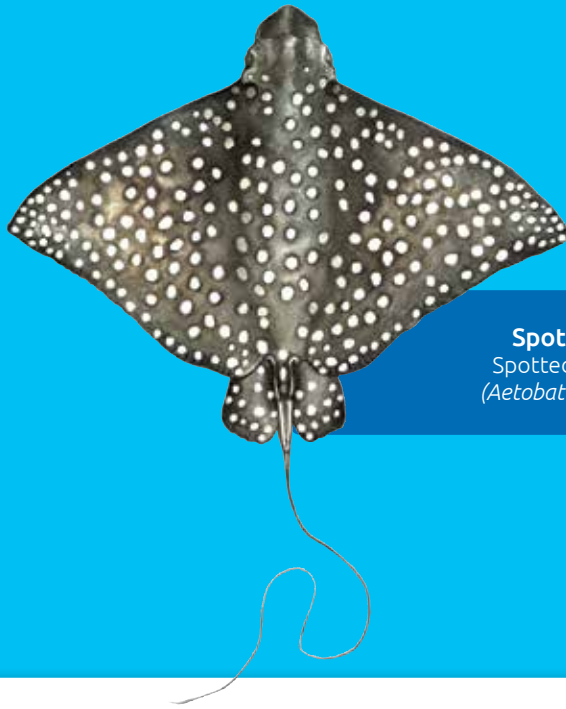
Spot ikol rei Spotted eagle ray ( Aetobatus ocellatus )