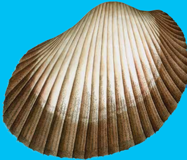
Kokias Antique ark ( Anadara antiquata )