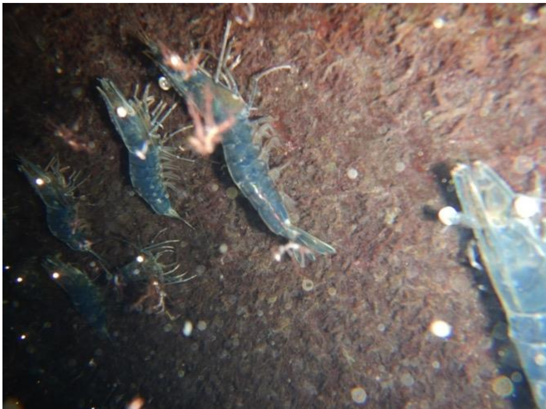
Figure 6 : L. stylirostris , se nourrit du fouling poussant sur les filets des cages dans lesquelles elles sont élevées en Polynésie française.

L'estimation chiffrée pour un projet pilote de 5 à 10 tonnes se situe autour de 12 à 15 millions de FCFP (hors installations à terre)