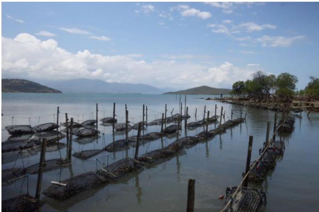
Figure 4 : La ferme artisanale de Patrick Morlet en Nouvelle-Calédonie est le parfait exemple d'une petite unité ostréicole destinée au marché local.

Les besoins humains estimés pour cette activité sont de 2 personnes pour une petite ferme pouvant produire quelques milliers de douzaines de coquilles par an. On estime qu'une petite ferme ostréicole nécessite un investissement entre 4 et 5 millions de XPF.