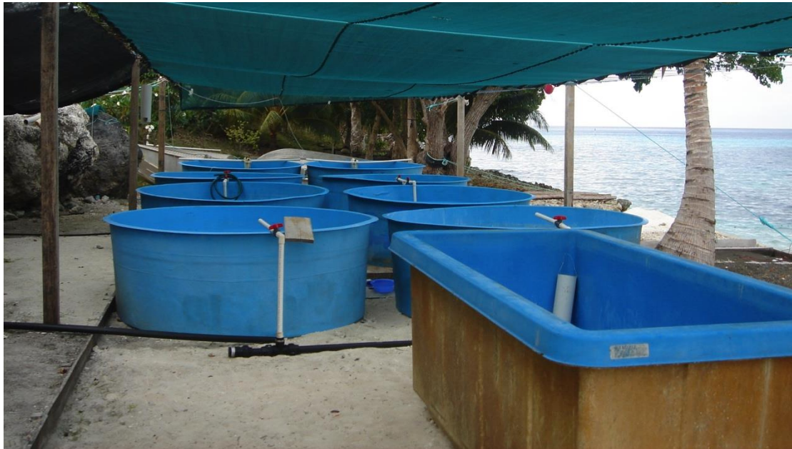
Figure 1 : Exemple d'une éclosérie multifonction. Celle-ci se situe aux îles Salomon, idéalement située en bord de mer. Sa conception simple est modulable. Cette zone de nurserie est accompagnée d'une éclosérie dans un local fermé.

Dans son design et pour plus de simplicité, cette éclosérie devra aussi servir de labo humide et de station de quarantaine dans l'hypothèse de la nécessité d'importation de matériel biologique.