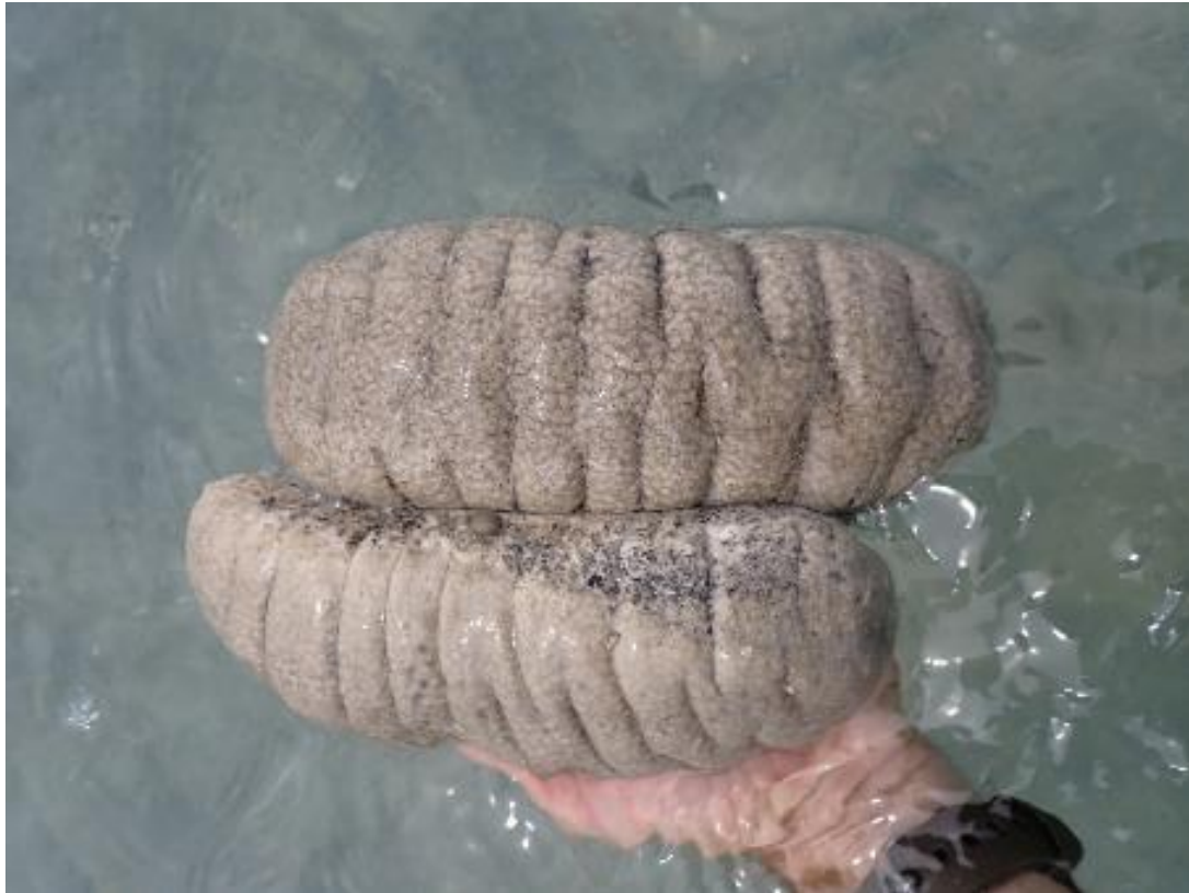
Figure 2 : H. scabra , l'holothurie des sables, bien représentée à Wallis, est une espèce de prédilection pour l'aquaculture.