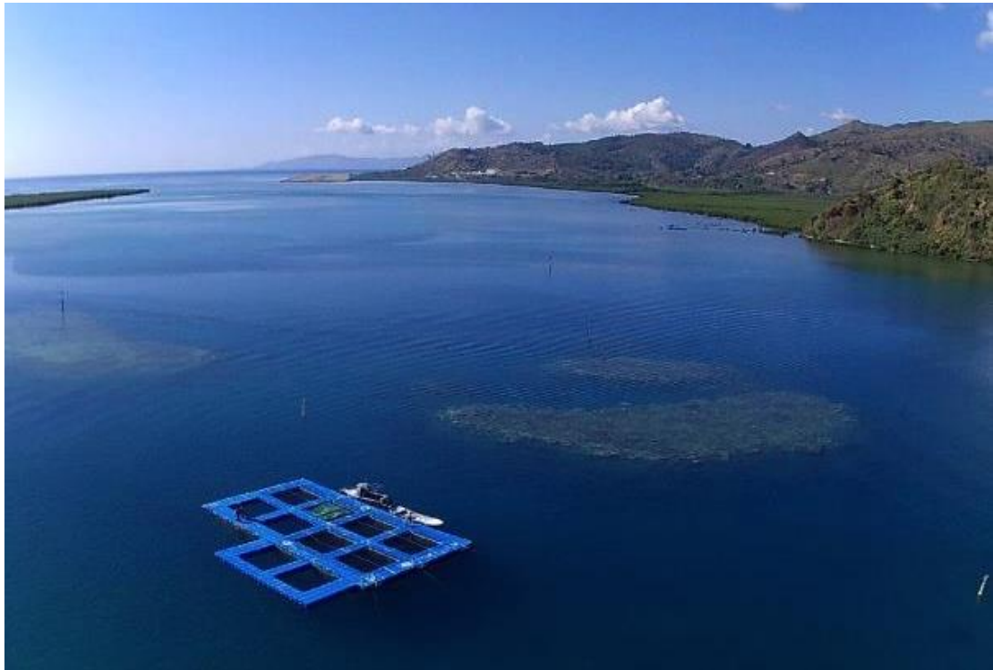
Figure 5 : une série de cages en mer destinées à l'élevage de poisson en Nouvelle-Calédonie, envisageable dans le lagon de Wallis

Il est important de noter que le niveau de technicité et d'assiduité au travail est relativement élevé pour cette activité, pour l'élevage des crevettes et des poissons. Les nourrissages sont quotidiens et les autres manipulations nécessitent du personnel formé.