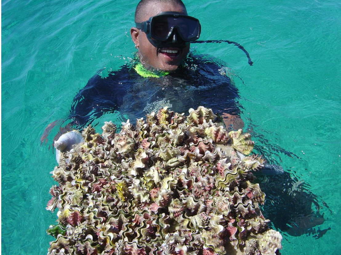
Figure 3 : A Arno, aux îles Marshall, les bénitiers sont élevés sur des plaques de bétons dans des cages jusqu'à une certaine taille avant d'être réintroduits dans le milieu naturel. Le travail se fait en plongée libre. Ici une centaine de T. squamosa .