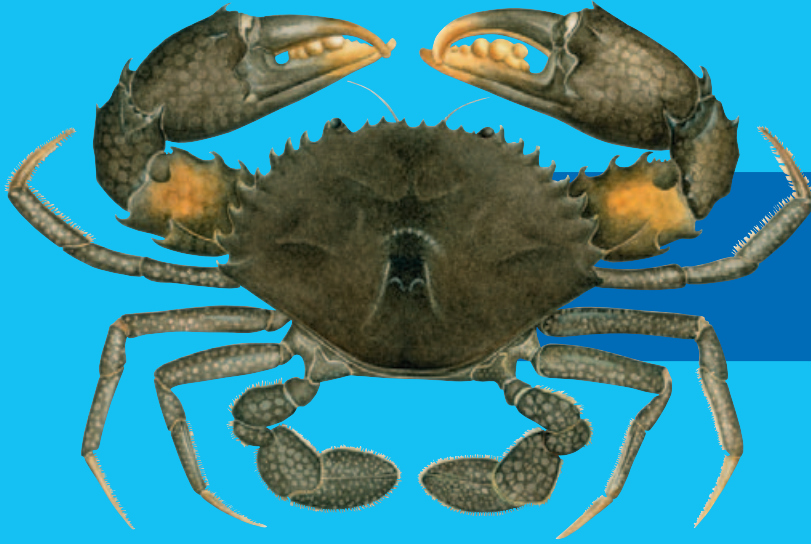
Qari dina, Bakera ( Scylla serrata )