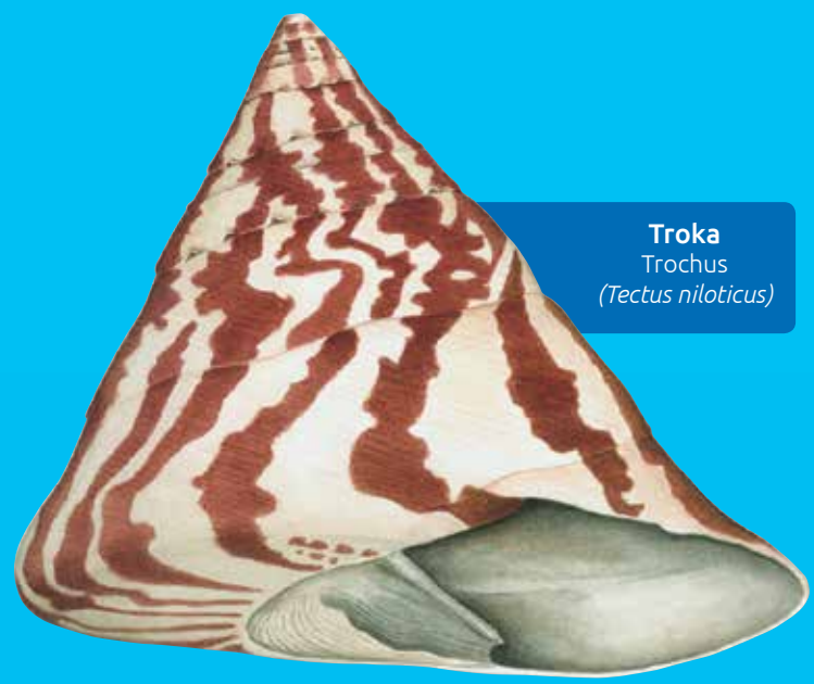
Troka Trochus ( Tectus niloticus )