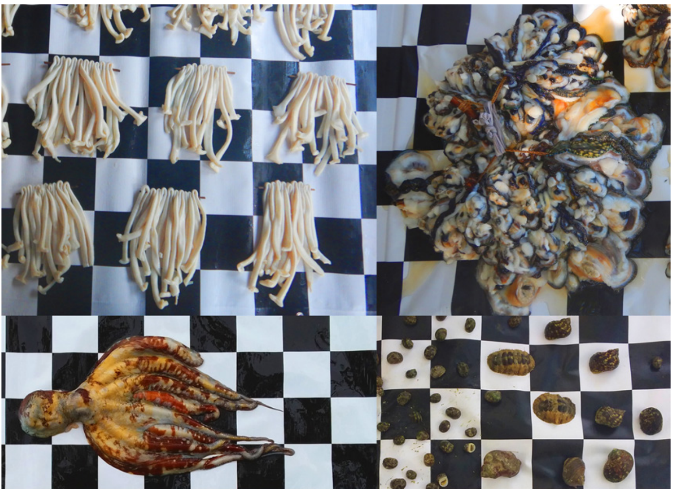
Figure 3. Montage de photographies d'invertébrés de Kiribati et de Vanuatu présentés tels qu'ils sont habituellement pêchés. Dans le sens des aiguilles d'une montre, à partir de la photo en haut à gauche : chapelets de sipuncles ( Sipuncula sp.), chapelet de chair de bénitiers ( Tridacna sp.), escargots et chitons ; poulpe.

De nombreux plans de gestion communautaire des pêches et travaux sur les pêches récifales sont axés sur le poisson. On en sait beaucoup moins sur les invertébrés, qui posent des difficultés spécifiques et en grande partie irrésolues en ce qui concerne le suivi et l'évaluation des plans de gestion communautaire des pêches (fig. 3). Les invertébrés représentent une part importante des prises dans de nombreuses parties de la région, en particulier à Kiribati et dans certaines zones des Îles Salomon, d'après nos observations. Lors d'une visite dans une communauté de Kiribati, 75 des prises observées étaient entièrement composées d'invertébrés, et seulement 29 comprenaient du poisson. Les descriptions des prises de certains invertébrés tels que les trocas, les bivalves et les buccins sont relativement simples, tandis que celles des taxons à corps mou tels que les holothuries, les polychètes, les poulpes et les calmars présentent des difficultés de taille. Les algues posent des problèmes similaires en ce qui concerne tant l'estimation de la taille que le traitement des images. Nous avons enregistré de nombreuses photographies de