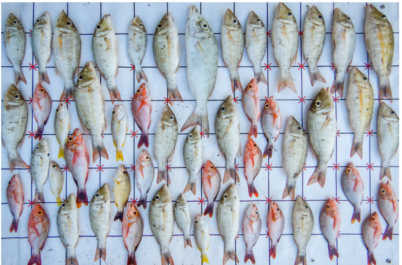
Figure 2. Exemple de prise à Kiribati, constituée de petits poissons de deux familles seulement : vivaneaux (lutjanidés) et empereurs (lethrinidés) des eaux tropicales.

Ce choix présente des avantages et des inconvénients de taille. Il est moins contraignant pour les pêcheurs participants qui terminent leur journée de travail et réduit les dommages qu'entraîne une exposition prolongée des prises aux éléments. Une photographie fournit par ailleurs une trace permanente de la prise, qui permettra de vérifier les erreurs ou pourra être utilisée à des fins qui n'ont pas encore été envisagées. Les photographies permettent également de mieux contrôler l'exactitude et la cohérence de l'identification des poissons. À ce jour, plus de 300 espèces de poissons ont été relevées dans les prises. Étant donné que la méthode devrait pouvoir être utilisée par différents enquêteurs, une identification adéquate des espèces entraînerait une lourde charge de formation pour les ressources des projets et des services nationaux. Par ailleurs, cette méthode suppose que les observateurs des prises produisent des photographies de qualité, les administrent et assurent la maintenance des tablettes.