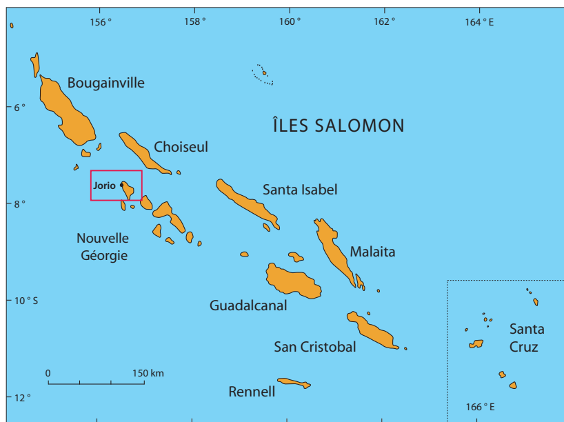
Figure 1. Région de Jorio, notre zone d'étude dans le nord de Vella Lavella (Îles Salomon).

d'une formation et ont travaillé aux côtés des scientifiques du WorldFish. À chaque débarquement, les captures ont été enregistrées sous leur nom en bilua. Au cours de la même période d'étude, des entretiens libres ont été conduits avec une dizaine d'informateurs clés. Une dizaine de discussions dirigées informelles ont également été tenues avec des pêcheurs afin de fixer de manière plus précise et de mieux comprendre la nomenclature bilua. Les entretiens et les discussions ont eu lieu en pidgin. Pour déclencher la parole et animer les discussions, nous avons utilisé les noms des poissons et invertébrés identifiés dans les relevés de prises, ainsi que des livres illustrés contenant des descriptions taxonomiques des poissons (Allen et al. 2003), des invertébrés et des plantes marines (Allen et Steene 1994). Au cours des discussions, nous avons cherché à déterminer ou à vérifier l'orthographe et la prononciation des noms vernaculaires, les espèces appartenant à chaque taxon local, les relations entre taxons (appartenance à une même « famille »), l'étymologie (origine et signification du nom), et toutes les variantes des noms locaux. La plupart des discussions dirigées visaient des groupes d'hommes ou des