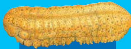
Karifis Curryfish ( Stichopus hermanni )