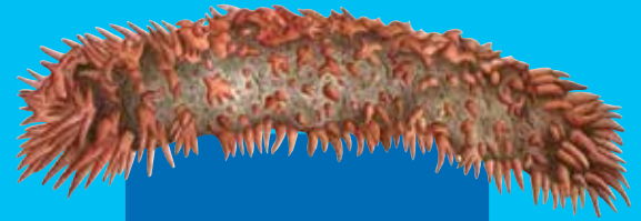
Paenapolfis Prickly redfish ( Thelenota ananas )