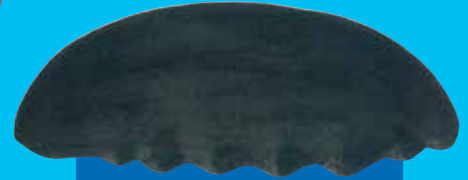
Blak titfis Black teatfish ( Holothuria whitmaei )