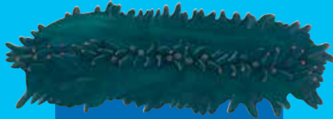
Krinfis Greenfish ( Stichopus chloronotus )