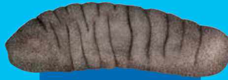
Sanfis Sandfish ( Holothuria scabra )