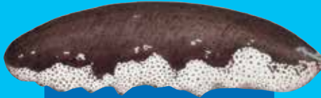
Waet titfis White teatfish ( Holothuria fuscogilva )