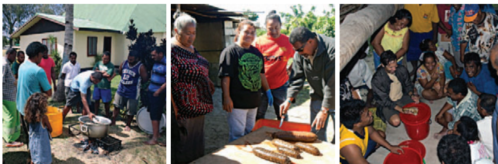
Les ateliers de formation sur la valorisation après récolte dispensés aux Fidji (gauche), aux Tonga (centre) et à Kiribati (droite).

Le projet est dirigé par l'Université Southern Cross et réalisé avec la collaboration de l'ONG Partners in Community Development Fiji, du ministère de l'Agroalimentaire, des Forêts et des Pêches des Tonga, du ministère des Pêches et des Ressources marines de Kiribati, de l'Université James Cook et du Secrétariat général de la Communauté du Pacifique.