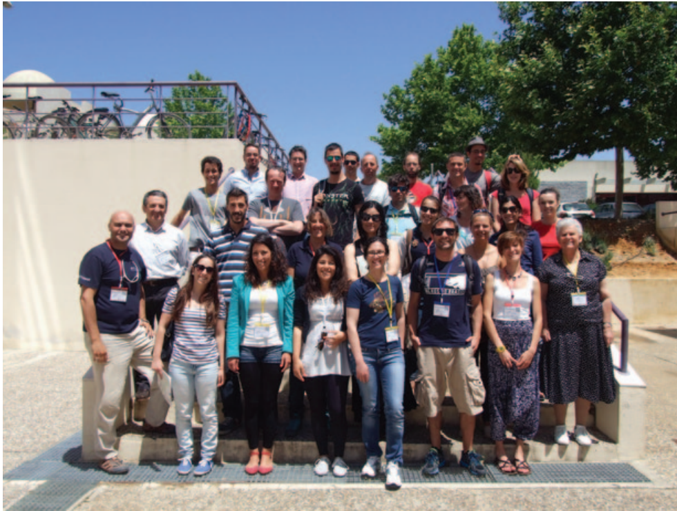
Les participants à l'atelier.