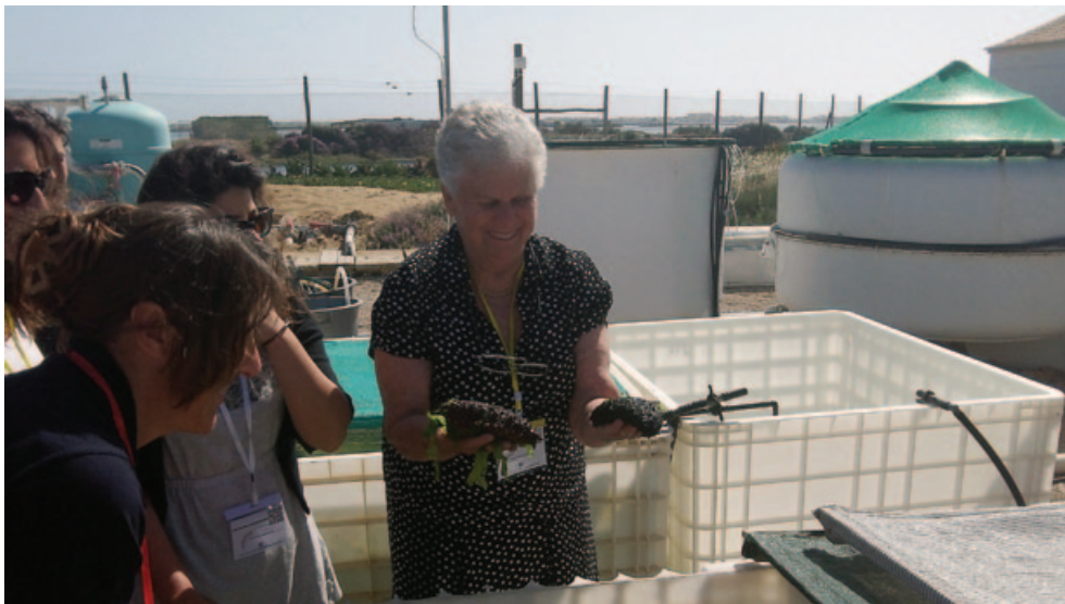
Visite au laboratoire de terrain de Ramahete : examen d' Holothuria arguinensis .