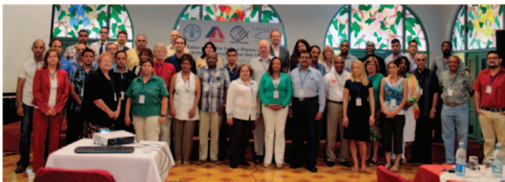
Photo des participants à l'atelier.