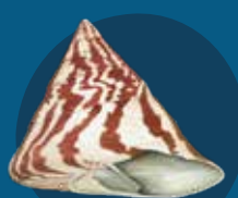
Troka Rochia nilotica

Long Vanuatu, i gat troka, shel mo olgeta bigfala natalae we oli save gat posen long olgeta