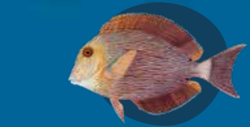
Blak fis Acanthurus nigroris

Hemia hemi olgeta fish long Vanuatu we oli moa posen: