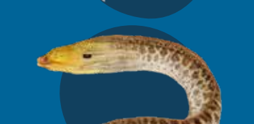
Bigfala namarae Gymnothorax javanicus