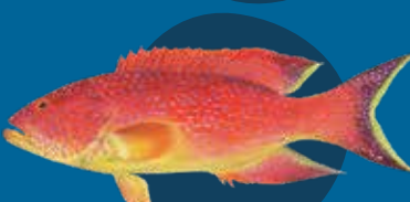
Flawa Los Variola louti