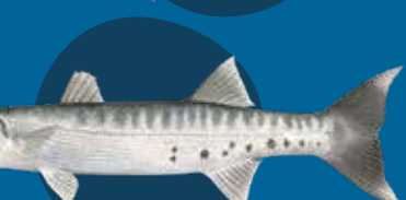
Sawfis Sphyraena barracuda