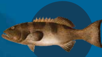
Blak mo waet los Plectropomus laevis