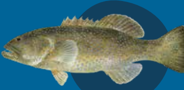
Spotted los Plectropomus areolatus