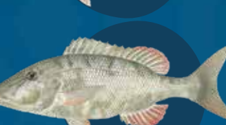
Longnos red maot Lethrinus olivaceus