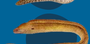
Yelo-tel namarae Gymnothorax flavimarginatus