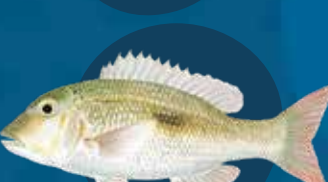
Blakspot red maot Lethrinus harak