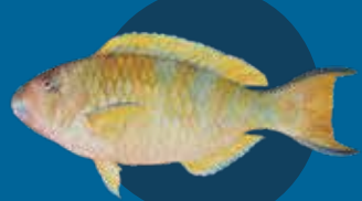
Blufis Scarus sp.