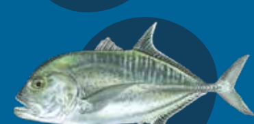
Blak Karong Caranx ignobilis