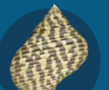
Big Ae Turbinidae