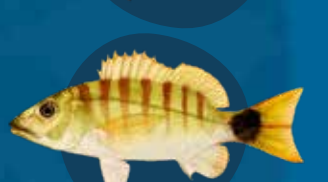
Blak straep snapa Lutjanus semicinctus