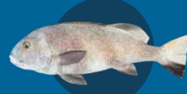
Blak switlip Plectorhinchus albobittatus