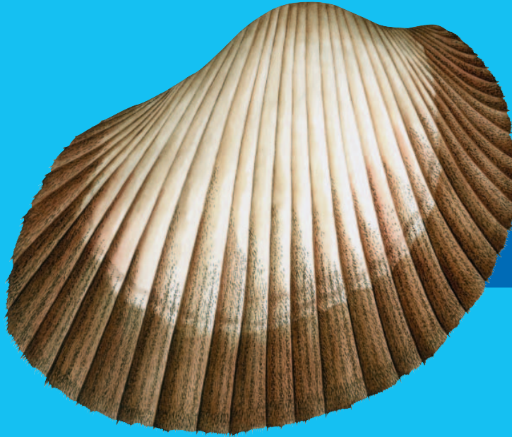
Kaikoso ( Anadara antiquata )