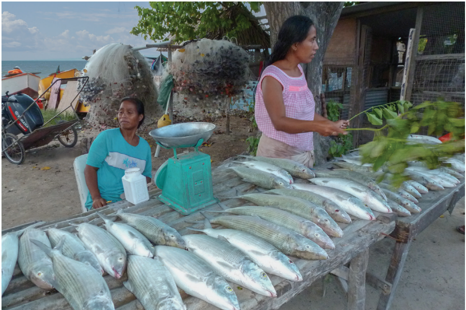
Banane lèvres ronde ( Albula glossodonta ) en vente sur l'atoll d'Abemama, à Kiribati.

Ressemble à Albula argentea (pas de photo) mais s'en distingue par l'absence de tache jaune à la base des pectorales.