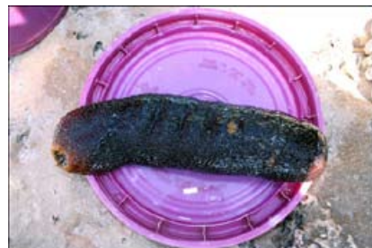
Figure 3. Namonha ( Bohadschia sp. )