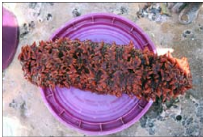
Figure 1. Subinho ( Thelenota ananas )

Une autre espèce, probablement Holothuria fucogilva (figure 4) (C. Conand comm. pers.) a été ramassée occasionnellement, à titre d'information secondaire. Je ne suis donc pas certain du nombre d'espèces et de types d'holothuries que les pêcheurs sont capables d'identifier.