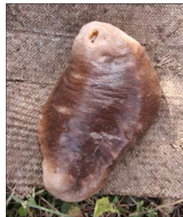
Figure 4. Holothuria fucogilva ?