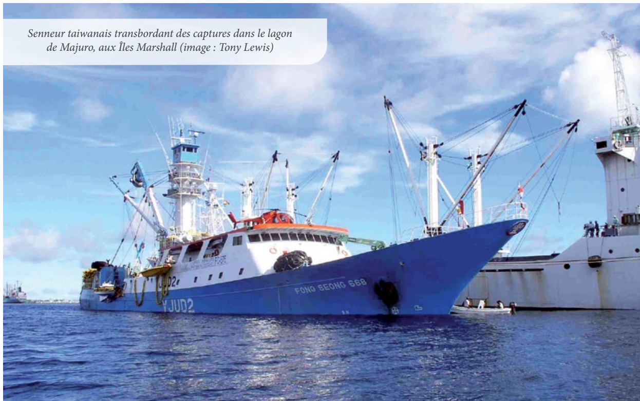
Senneur taiwanais transbordant des captures dans le lagon de Majuro, aux Îles Marshall

Le rapport peut être téléchargé à l'adresse suivante : http://www.ffa.int/node/567