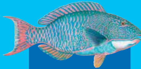
Spoted parotfis Spotted parrotfish ( Cetoscarus ocellatus )