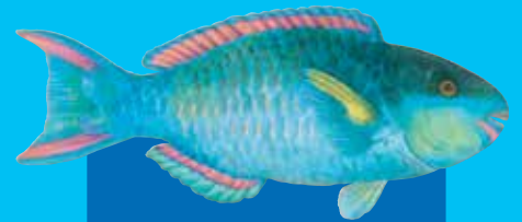
Dakap parotfis Darkcapped parrotfish ( Scarus oviceps )