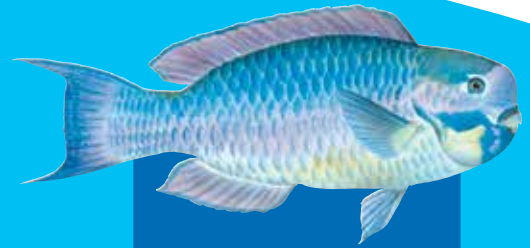
Stiphed parotfis Steephead parrotfish ( Chlorurus microrhinos )