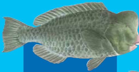
Stonhed parotfis Green humphead parrotfish ( Bolbometopon muricatum )