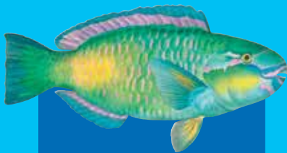
Deisy parotfis Daisy parrotfish ( Chlorurus sordidus )