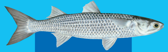
Kotō ( Mugil cephalus )