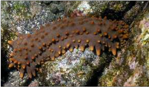
Figure 2. L'holothurie des Galápagos Isostichopus fuscus