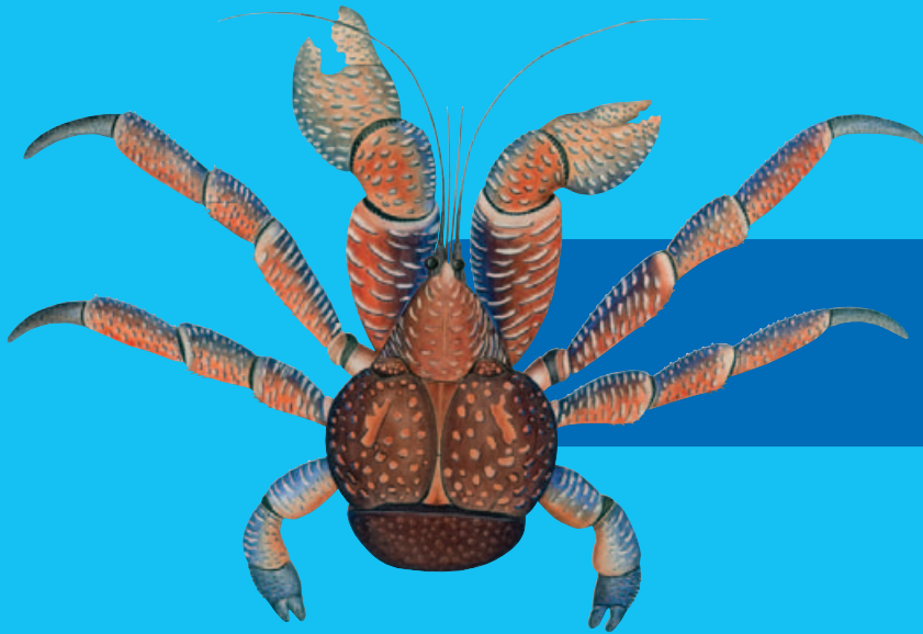
Ugavule ( Birgus latro )