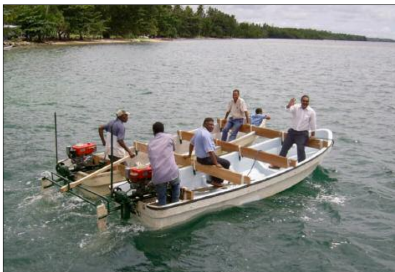
Le « Coco-cat »