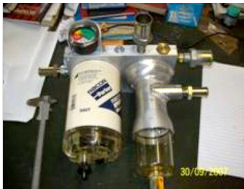
Échangeur de chaleur et système de filtres