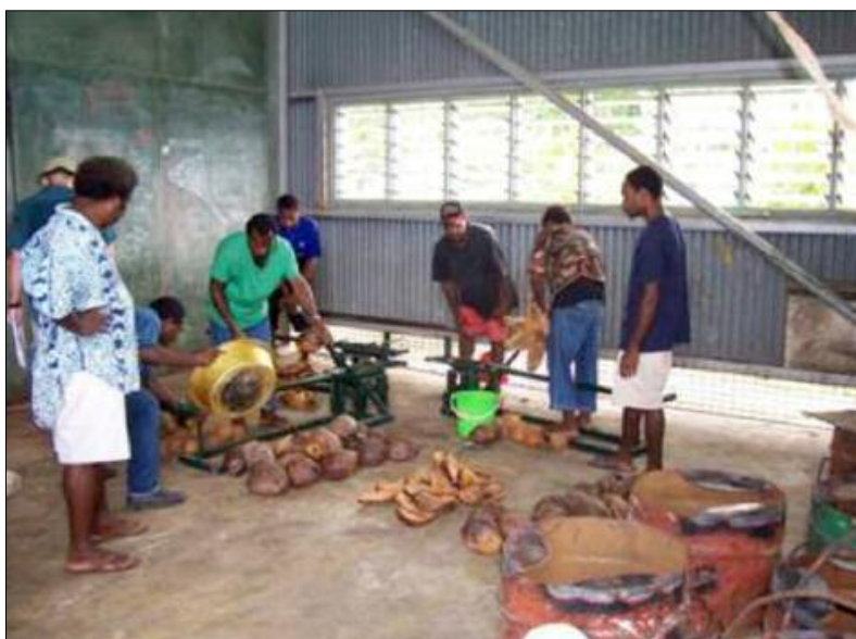
Extraction de l'huile de coprah avec une presse à main