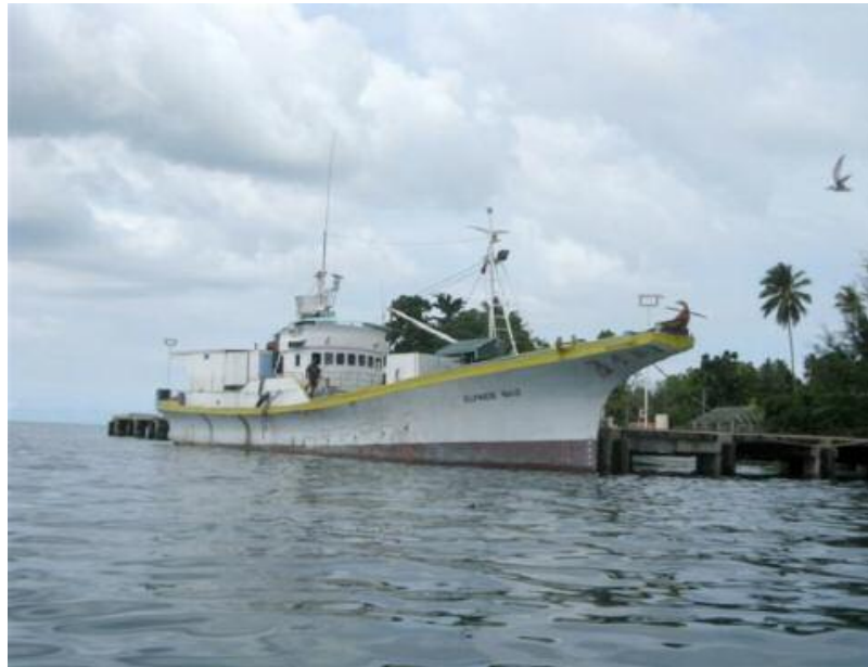
L'Elfride : deux ans de fonctionnement à l'huile de coprah brute

divers types de moteurs, dont celui d'une camionnette Hilux Toyota, d'un camion Toyota de 5 tonnes, un groupe électrogène Cummins à moteur rotatif à injection turbocompressé, et un moteur Nigata de 450 cv vieux de 30 ans.