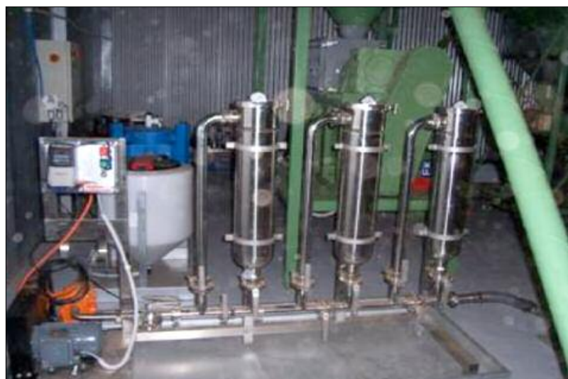
Système de filtrage à manche de 5 microns