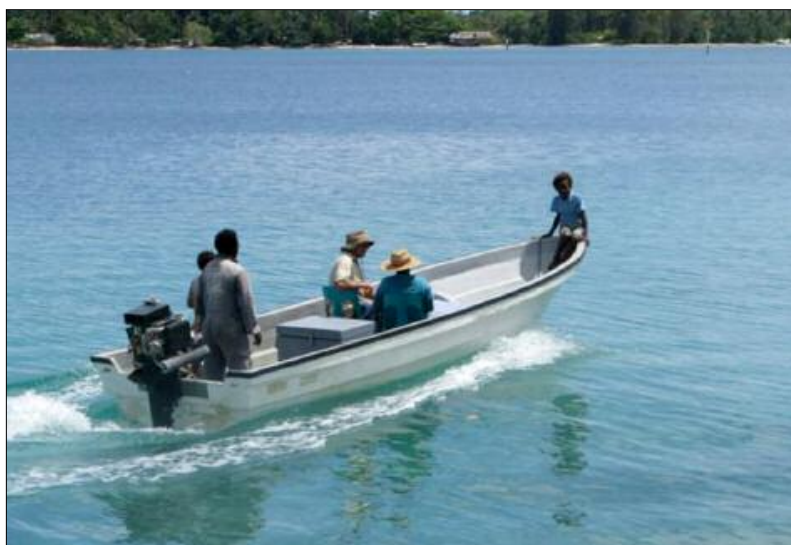
Le Sunsette Rigby 22