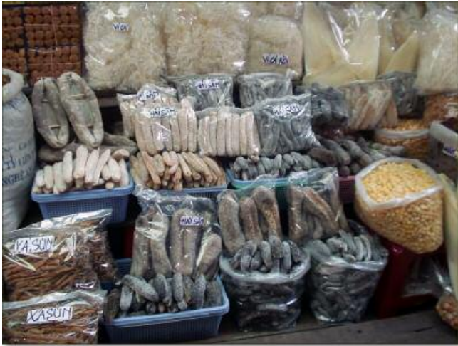
Figure 1. Des bêches de mer sur le marché de Cholon, Ho Chi Minh Ville