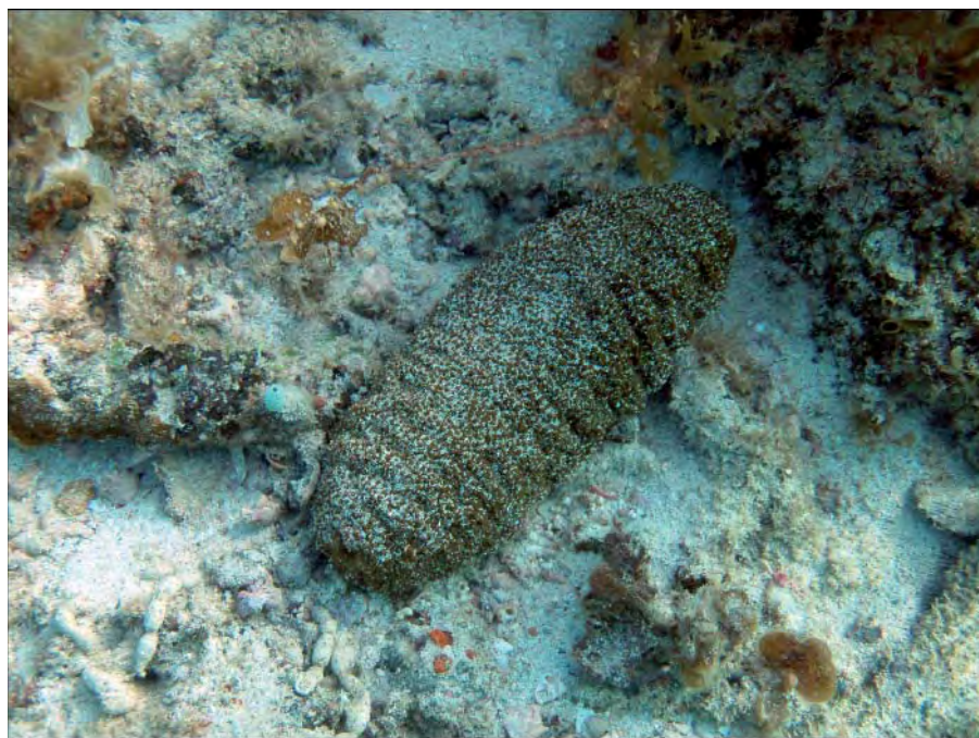
Figure 1. Actinopyga echinites .

X est la variance d'une taille de blocs donnée, N est le nombre total de quadrats dans un transect, x_1 est le nombre de spécimens présent à l'intérieur du premier quadrat du transect, x_2 est le deuxième quadrat et x_N est le dernier quadrat. Des calculs analogues à l'équation 3 sont effectués à des tailles de blocs de plus en plus importantes (Ludwig et Reynolds 1988). Les calculs de la TTLQV ont été réalisés au moyen de Microsoft Excel, bien que l'utilisation de Microsoft Visual Basic soit recommandée pour des transects plus longs de quadrats contigus.