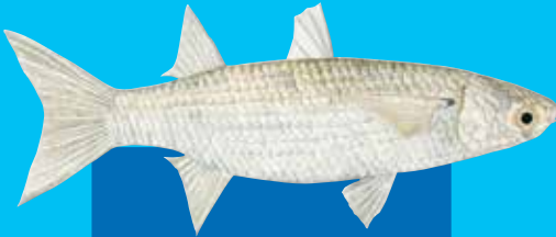
Bolfae malet Fringlip mullet ( Crenimugil crenilabis )