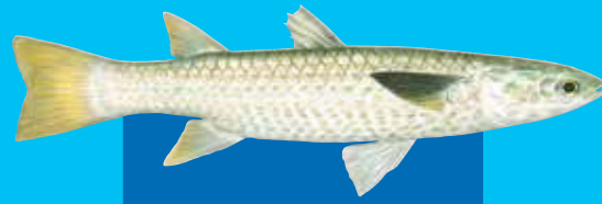
Yelo tel malet Squaretail mullet ( Liza vaigiensis )