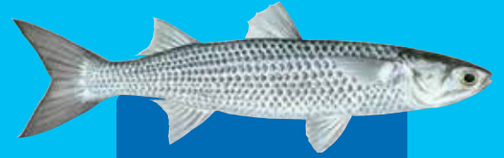
Flathed malet Flathead grey mullet ( Mugil cephalus )