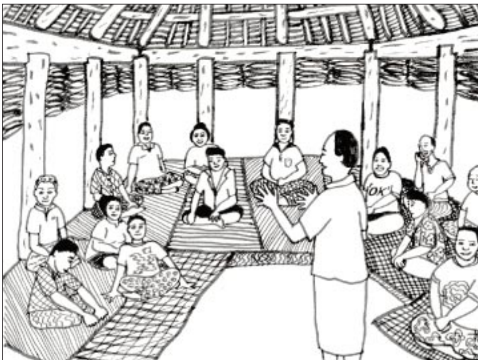
S'appuyer sur la structure communautaire traditionnelle

Après toute une série de réunions, l'étape suivante consistait à élire un comité local de gestion des pêches, composé de représentants de chacun des groupes; les femmes furent, là encore, invitées à par-