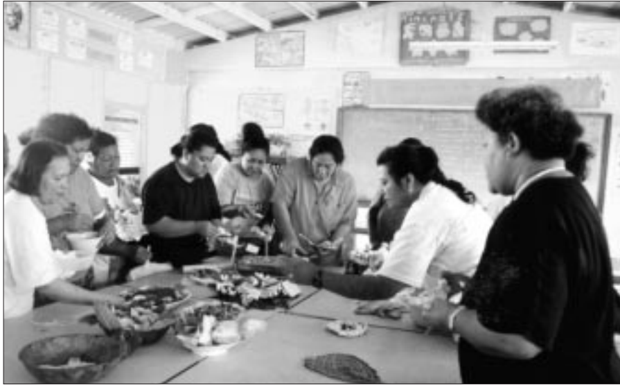
L'importance de la présentation des produits de la mer a été soulignée au cours du stage. La présentation des plats reflète cette recherche esthétique.