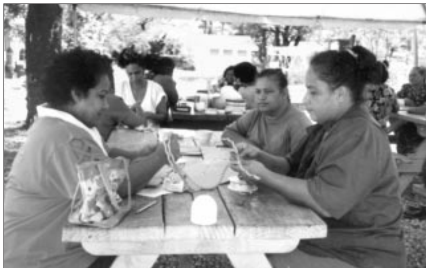
Une activité très populaire parmi les pêcheuses nauruanes : l'épissure de cordages

Faute de poulpes, des anguilles ont été utilisées pour les exercices culinaires. Les participantes ont remporté leurs prépara-