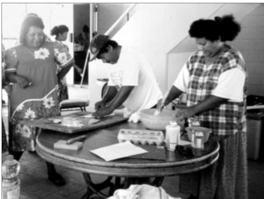
Préparation de la pêche fraîche : une première étape importante pour la réalisation de recettes. Ici, les stagiaires de l'atelier de la base de pêche d'Ebeye se passionnent pour les techniques de traitement primaire et secondaire.

L'atelier d'artisanat du coquillage a réuni dix-huit femmes qui tirent leurs revenus de la vente de leur production. Les stagiaires ont pu se familiariser avec