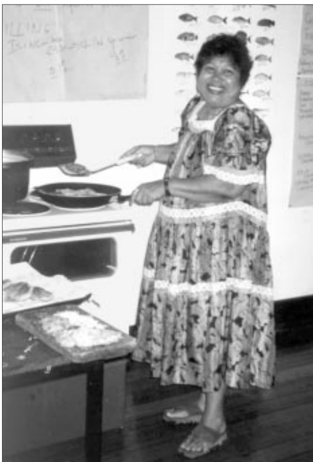
La présidente du Conseil des femmes de Nauru s'essaie à la préparation de steaks de poisson.

La cérémonie de clôture commença à 15 heures. Dans son allocution, le ministre de la pêche, M. Bernard Dowiyogo, invité d'honneur, déclara que la création d'un poste de chargée de la promotion des femmes dans le secteur des pêches venait d'être approuvée pour le service des pêches et des ressources marines.”