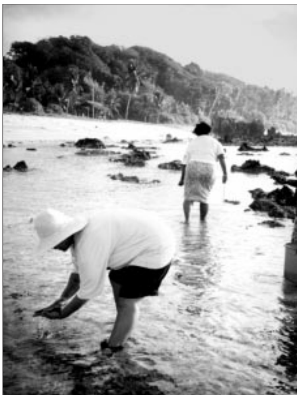
À Nauru, les bèches-de-mer récoltées entrent dans la composition de plats de produits de la mer non traditionnels.

tions pour les faire goûter aux membres de leurs familles. Les stagiaires ont appris à mesurer à la main les espèces de bèches-de-mer récoltées. Pour pouvoir être ramassées, les bèches-de-mer doivent s'étendre de l'extrémité du majeur au poignet. Tous les animaux de taille inférieure sont rejetés à la mer. Quant aux oursins, les stagiaires ont appris à ne prélever que quelques exemplaires de chaque groupe et à en laisser suffisamment dans l'eau pour assurer la reproduction.