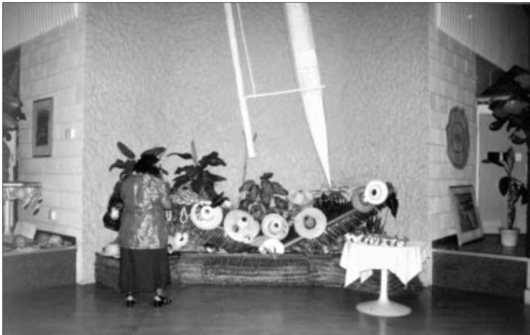
Les stagiaires sont fières d'exposer leur production artisanale à base de coquillage lors de la cérémonie de clôture.