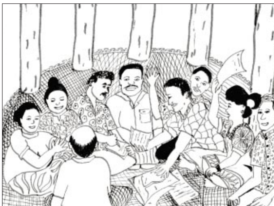
L'ensemble de la communauté devrait participer à la gestion et au développement de la pêche.

Le gouvernement samoan est de plus en plus préoccupé par l'état des récifs et des lagons et la diminution des prises de poisson. Il reconnaît également qu'il ne suffit pas de promulguer des lois nationales pour protéger efficacement les stocks de poisson et