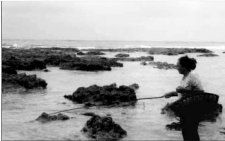
Tous les membres de la famille aiment pratiquer la pêche au kaloama (surmulet cordon jaune) à l'aide d'une canne en kafika (un bois local) pendant la saison du kaloama à Niue.

À la différence des participantes des Îles Marshall, celles de Niue n'ont pas trouvé la charque de thon à leur goût. Elles préfèrent le poisson fumé et les nouvelles recettes apprises au cours du stage : bêche-de-mer farcie, sashimi et autres.