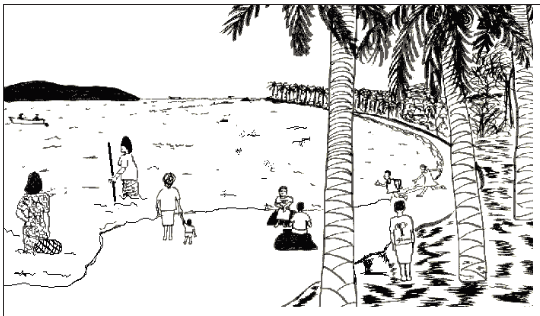
Des femmes participent à la pêche...

La plupart des Océaniens connaissent le rôle majeur des femmes dans la récolte, le traitement et la commercialisation des ressources marines. Il suffit de jeter un coup d'œil sur de nombreux lagons et zones côtières pour constater que la majorité des personnes que l'on voit sur le récif sont des femmes. Ce sont elles qui se chargent du traitement des espèces marines récoltées tant par des hommes que par des femmes.