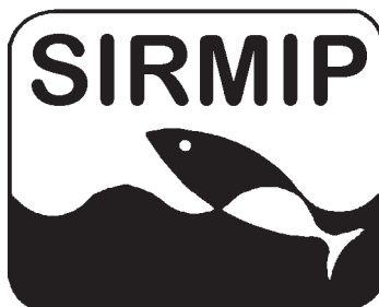
Système d'Information sur les Ressources Marines des Îles du Pacifique

Le SIRMIP est un projet entrepris conjointement par 5 organisations internationales qui s'occupent de la mise en valeur des ressources halieutiques et marines en Océanie. Sa mise en oeuvre est assurée par le Secrétariat général de la Communauté du Pacifique (CPS), l'Agence des pêches du Forum du Pacifique Sud (FFA), l'Université du Pacifique Sud, la Commission océanienne de recherches géoscientifiques appliquées (SOPAC) et le Programme régional océanien de l'environnement (PROE). Ce bulletin est produit par la CPS dans le cadre de ses engagements envers le SIRMIP. Ce projet vise à