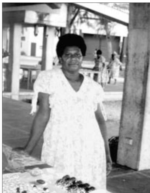
Ce sont en majorité des femmes qui vendent les produits de la mer au Vanuatu.

Parmi les pays qui ont récemment demandé à la section d'organiser des enquêtes sur le terrain et des ateliers et d'apporter un soutien à des projets rémunérateurs, il faut citer Tuvalu, Palau, les États fédérés de Micronésie et les Îles Mariannes du Nord. Des demandes officieuses de travail en collaboration avec le projet Valorisation des produits de la pêche de l'Université du Pacifique Sud et des diplômés de l'USP ont également été reçues.