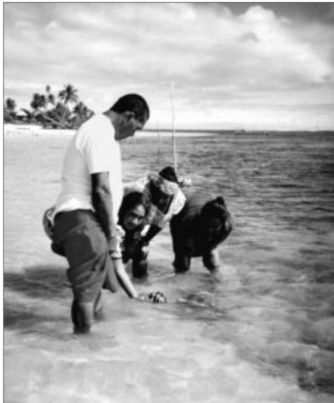
Contrôle de la progression des bénitiers dans la réserve de poissons de Satoalepai, Savaii, Samoa