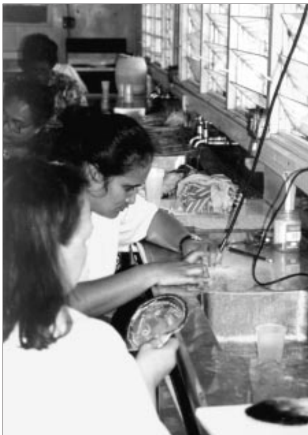
Au cours de l'atelier d'artisanat du coquillage, les stagiaires de Niue apprennent à ciseler les huîtres perlières.

d'artisanat du coquillage, tandis que les stagiaires en transformation des produits de la mer proposaient des plats qu'elles avaient préparés aux convives du dîner de clôture.