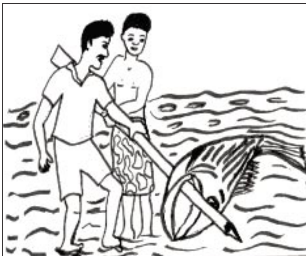
... et des hommes participent à la pêche.

Ce sont le plus souvent des femmes qui vendent des produits de la mer sur les marchés et sur le bord des routes. Affirmer que la pratique de la pêche et des activités connexes est l'apanage des hommes serait donc méconnaître la très grande contribution des femmes à la valorisation des ressources marines.