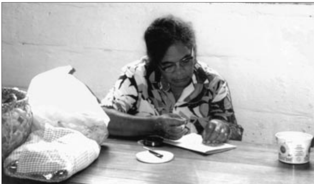
Des groupes d'artisans des villages se rencontrent chaque semaine dans les quatorze villages de Niue. A Alofi Sud, une femme confectionne des colliers à partir de hihi vao (petit escargot terrestre jaune). Les colliers se vendent 4 à 8 dollars néo-zélandais selon le modèle.