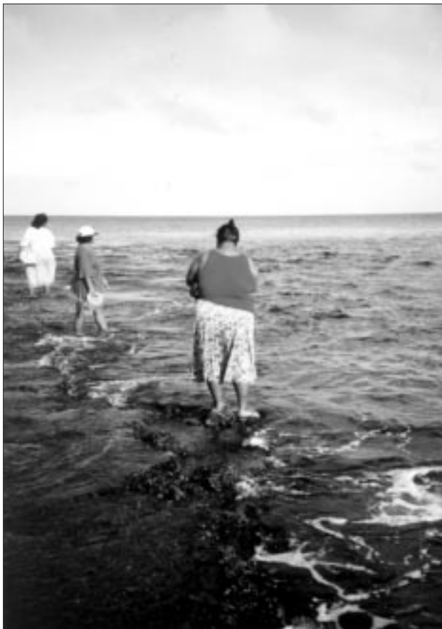
Les stagiaires testent leurs techniques de pêche à la palangrotte, à l'aide des lignes confectionnées lors de l'atelier de Nauru.

“Des palangrottes confectionnées la veille ont été testées dans le port, tandis que de nouvelles méthodes de pêche (pacage de poisson, pièges fixes à poissons et récifs artificiels) ont été discutées en salle de cours.