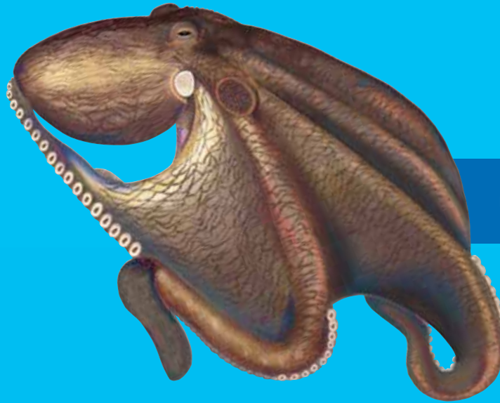
Bik blu nawita Big blue octopus ( Octopus cyanea )