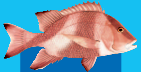
Damuninubu ( Lutjanus sebae )