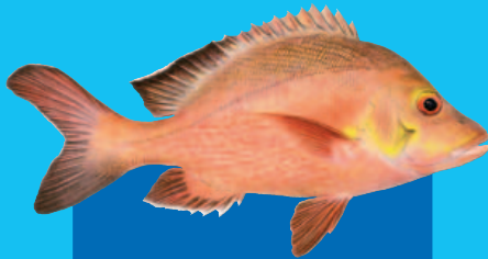
Bō, Yābō, Tāen ( Lutjanus gibbus )