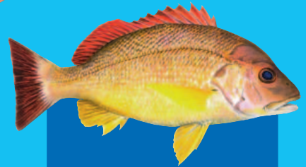
Tanabe, Dādreu ( Lutjanus fulvus )