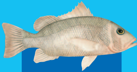
Damū, Damūniveitiri ( Lutjanus argentimaculatus )