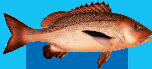
Bati, Baji ( Lutjanus bohar )